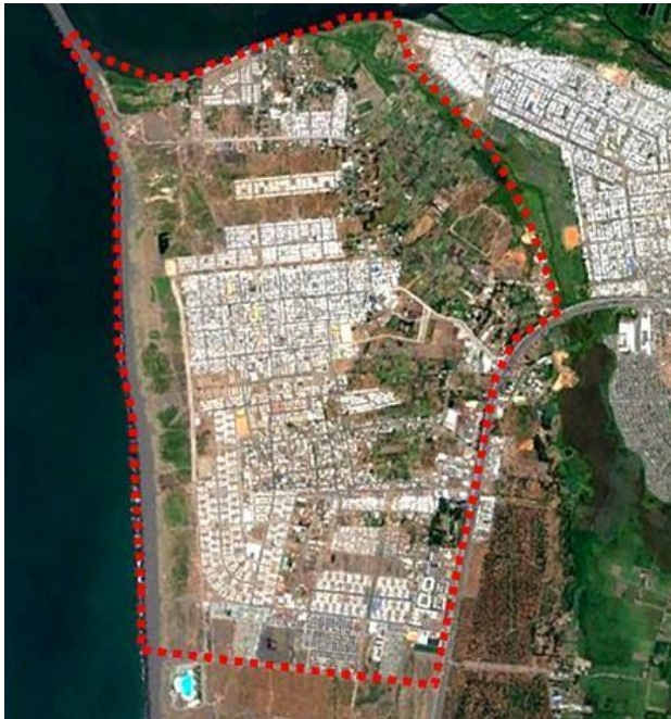
Fig6 -Polígono ZIP San Pedro de la Paz